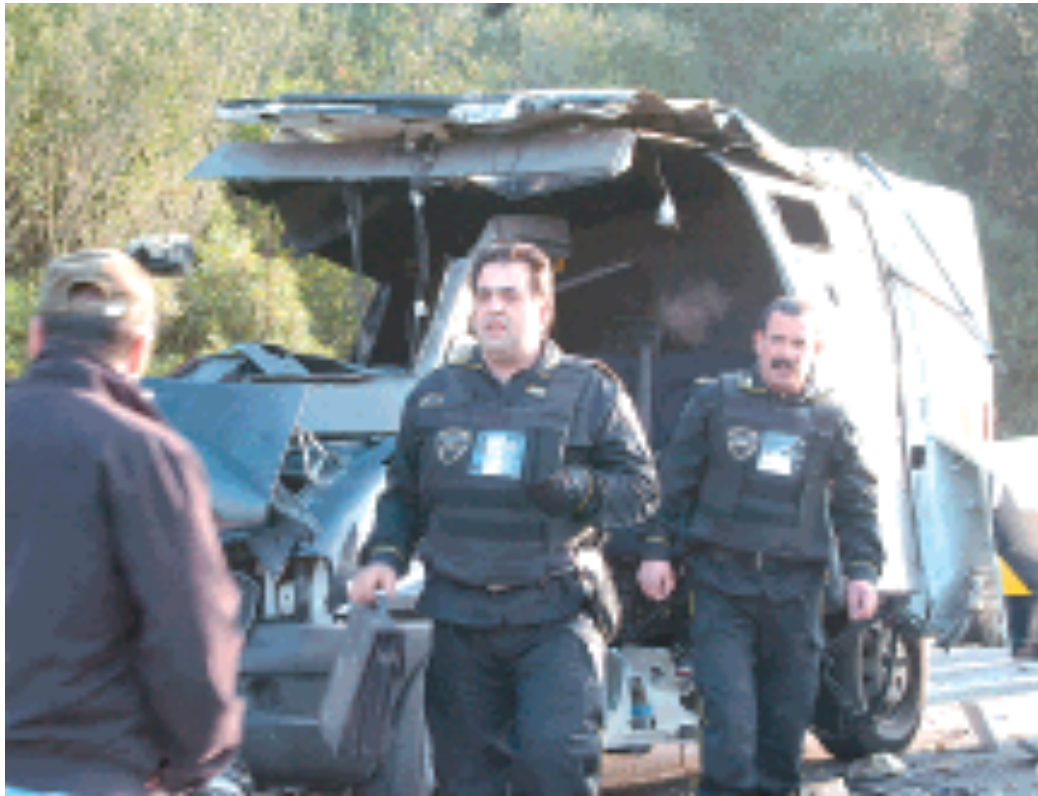
Le guardie giurate subito dopo l'assalto sulla Olbia-Arzachena