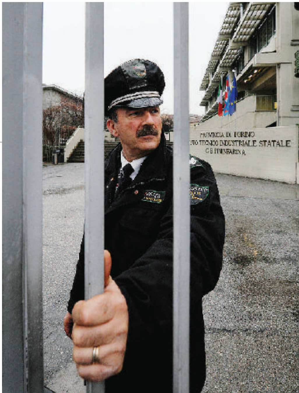
La guardia giurata che sorveglia l'ingresso dell'istituto tecnico Pininfarina

Ma per proteggere le immediate vicinanze del complesso la direzione si è rivolta ai vigilantes della Allsystem di Torino. Costo del servizio circa 4 mila euro, per un'ora al giorno, dalle 13 alle 14. Soldi ben spesi? «Noi la consideriamo una contromisura per rafforzare la sicurezza attorno alla scuola e per tranquillizzare le famiglie». Funziona? «Qui vicino sì. Consigliamo comunque ai ragazzi di fare sempre molta attenzione quando tornano a casa. E di non avere paura di denunciare qualsiasi fatto anomalo».